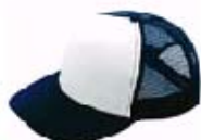
3101 ネイビー×ホワイト