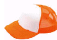
3126 蛍光オレンジ×ホワイト