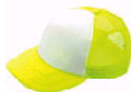
3124 蛍光イエロー×ホワイト