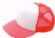
3122 蛍光ピンク×ホワイト