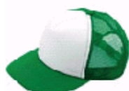
3108 グリーン×ホワイト