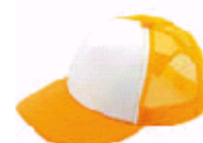
3110 イエロー×ホワイト