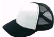
3111 ブラック×ホワイト