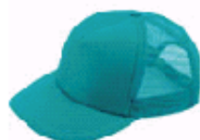
3113 エメラルドブルー