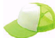
3120 蛍光グリーン×ホワイト