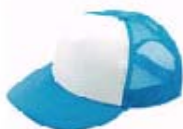
3102 スカイブルー×ホワイト